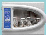
ES-20/80 Орбитальный шейкер