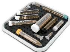
Био PP-4S с пупырчатым ков- риком PDM