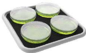
Био PP-4S с силиконовым ков- риком