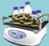
PSU-20i, Орбитальный шейкер