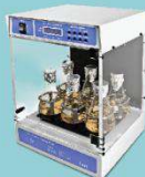
Применение: • Агглютинация • Окрашивание геля