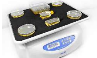
PP-480 с силиконовым коври- ком