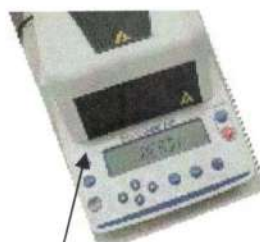
Место нанесения знака поверки