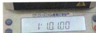
Рисунок 3 – Маркировка анализатора. Изображение номера версии ПО на дисплее