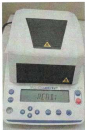
Рисунок 1 – Общий вид анализатора влажности весового АВГ-60

Общий вид анализатора представлен на рисунке 1.