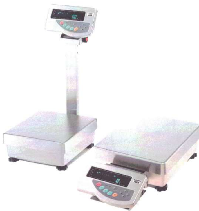
Рисунок 1 - Общий вид весов неавтоматического действия Н1

Принцип действия весов основан на преобразовании частоты вибрации акустического весоизмерительного датчика, возникающей при его растяжении или сжатии под действием взвешиваемого груза, в цифровой электрический сигнал, изменяющийся пропорционально массе взвешиваемого груза. Результаты взвешивания выводятся на дисплей.