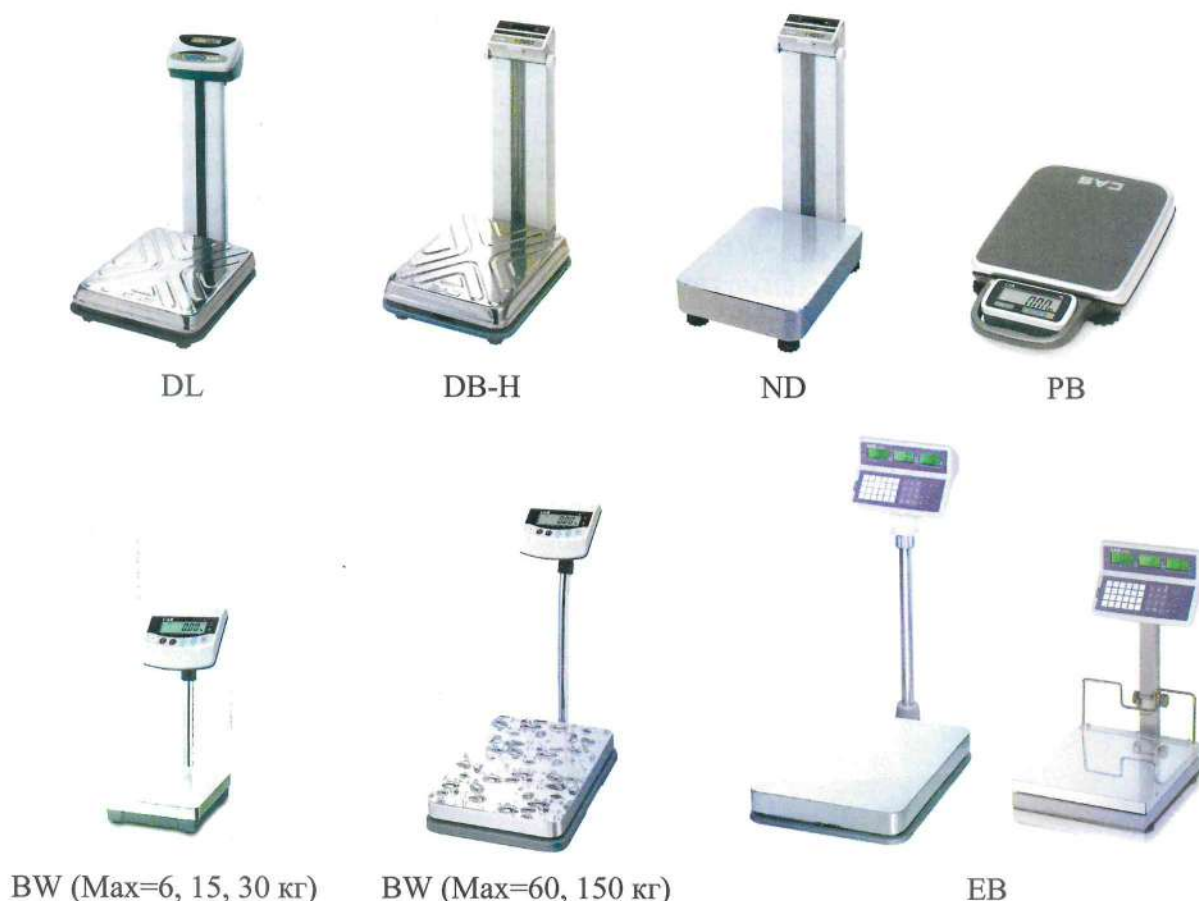
Рисунок 1 - Общий вид весов

Общий вид весов представлен на рисунке 1.