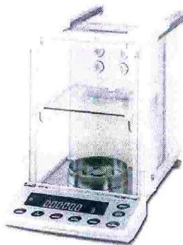
Рисунок 1 – Общий вид весов

Общий вид весов представлен на рисунке 1.