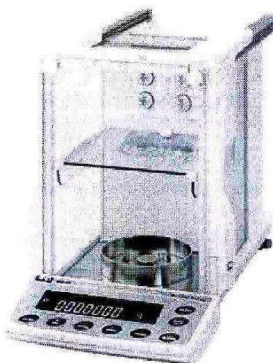
Рисунок 1 – Общий вид весов ВМ-G

Общий вид весов представлен на рисунке 1.